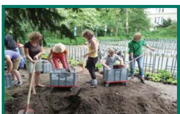
Eine weitere Pflanzaktion

Wir wollen mit dem Luttergarten etwas für jede(n) tun: für uns selber, für die Schule, für die Nachbarschaft, für die älteren Menschen in der Umgebung, für die Stadt. Unser Motto ist : „Wir bewegen!“