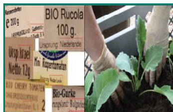
Ausländisch vs. Regional

Der Luttergarten ist ein mobiler, ökologischer Gemüsegarten für Alt und Jung. Wir bauen Salat, Kohlrabi, Möhren, Tomaten uvm. in transportablen Kisten an. Sie ermöglichen das Arbeiten im Sitzen, so dass auch Senioren ohne sich bücken zu müssen, mitpflanzen können. Zusätzlich ist der Garten mobil, damit er in den Schulferien in Senioreneinrichtungen weitergepflegt wird. Gärtnern in dieser Form schont die Umwelt, ist sozial und bildet.