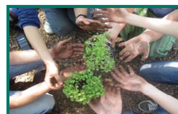
Ein Projekt für Jede(n)

So entsteht ein grünes GemüseNetz in Bielefeld!