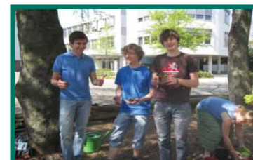
Eine von vielen Pflanzaktionen